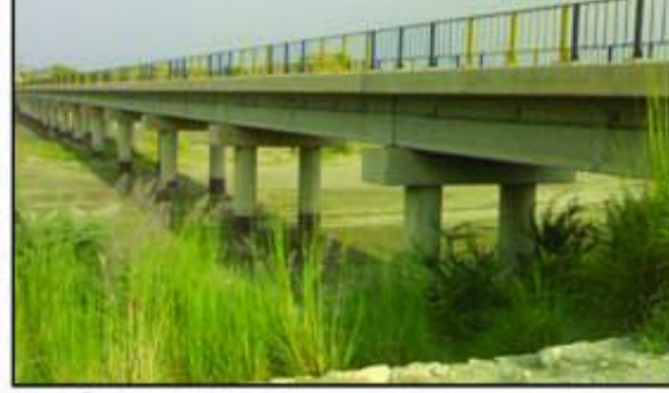
تخت لاہور سے ضلع گنگ نانا کی نوید تخت لاہور سے ضلع گنگ نانا کی نوید تخت لاہور سے ضلع گنگ نانا کی نوید

ادوات سیاسی منظر نامہ" کے منڈلاتے بادلوں کی ظہور پوری سے سیاسی اور علاقائی تقدیر کی تبدیلی کا دیا جاتا ہے۔ جسکے باعث وہر سپورڈ اور عوام جبران اور پیشان اور شہر شہر جاتے ہیں مگر پرامر جمہوری کی گوی بھی لکھنا پڑتی ہے۔ بعد ازاں قاری کی اس ضرب اہل کا دور کرتے نظر آتے ہیں۔ "ای دوست من جنی اگر دور سر و جہا نم نشین بازم دوست خوام دشت، چون تو عزیز می ہیش ہمہ چیز زیادہ زیادہ دوست واشہ با شہر ترجمہ: اے میرے رفیق اور قاری ہیں۔ جبکہ جدید علوم انگریزی زبان میں ہے۔ جو تمام سماجی حقائق نظر یار افاق ہا نظر یہ اضافیت پر پیشہ کا تو بھی میں تیرے سازاؤں کا ٹیکہ تو میرا نازمین ہے۔ ہمیشہ سدر (خوشنما) اور خوبصورت کے سب سازاؤں میں تیر اس" سیاسی ڈراما کا کیلبر پرنت اس لیے ہے کا داوے سوکانا جاتا ہے۔ کیونکہ "تعلیم ہی ان ماں" اب سیاسی مہربانوں کا کام تمام ہوا اور عوام کا سیاسی ذریعہ شناسی کے ہاں پیکر شروع۔ پھر اگلے انگلیشن تک خدا حافظ۔