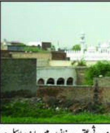
تخت لاہور سے ضلع گنگ نانا کی نوید تخت لاہور سے ضلع گنگ نانا کی نوید تخت لاہور سے ضلع گنگ نانا کی نوید

ہذا تاریخی ادارق میں چھپے حقائق سے انماض (تشم پوش یا پردہ پوشی) کرنا عوامی حقوق سے معاہدت (دشمنی) کے مترادف ہے۔ بلکہ حالات و واقعات کا تقاضا ہے۔ کہ تاریخی ادارق میں پوشیدہ مفاداتی کثیر یا کوکر پکر "عوامی جرائم کش" رائے شہاری کا چھڑکاؤ کر کے اپنا کھویا ہوا مقام حصول ممکن بنانا چاہیے۔ مقام لنگر ہے کہ ہم اپنی نسلوں کو کب تک و ذریعہ ازم، برادری از ازم اور مردنی تقدیر ہی نہیں کے پیاند مسائل کریں اور "اتفاق و اتحاد" کا دامن پکڑ کر اپنے حق کے حصول کیلئے میدان اتھاڑے۔ جو صدیوں سے