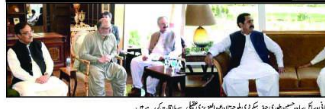
وفاقی وزیر اعلیٰ سندھ پارکس ایئر اور آئی اے سی کے سربراہی میں بلوچستان کے وفد سے ملاقات کر رہے ہیں

حق مستحقین کو ملنا اور حقیقت حقوق العبادی ہے، امتیاز لغت اللہ ظہیر حق مستحقین کو ملنا اور حقیقت حقوق العبادی ہے، امتیاز لغت اللہ ظہیر