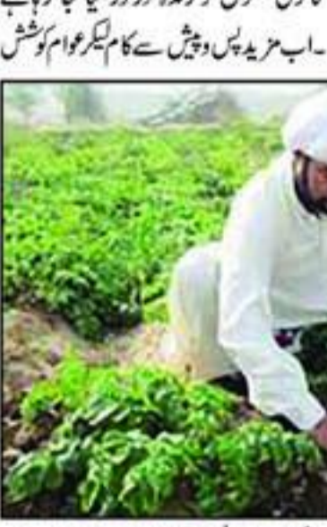
تخت لاہور سے ضلع گنگ نانا کی نوید تخت لاہور سے ضلع گنگ نانا کی نوید تخت لاہور سے ضلع گنگ نانا کی نوید