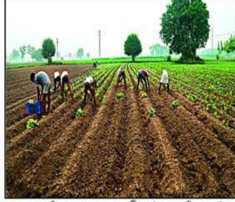
تخت لاہور سے ضلع گنگ نانا کی نوید تخت لاہور سے ضلع گنگ نانا کی نوید تخت لاہور سے ضلع گنگ نانا کی نوید

انہاں تکھتے ہیں۔ لیکن واجبات کی آدائیگی سے الٹا کوئی سروکار نہیں۔ مگر ان باسیوں کے ساتھ سر اسرا انصافی ہے۔ جو بل کی آدائیگی کے باوجود پائی کی ہونڈ پونڈ کرتے ہیں۔ اس بنیادی اہم انسانی مسئلے پر سیاست چکراری بجائے عوامی خدمت کو شعار بنانا چاہیے۔ مگر شہر کے کل عکسوں میں یہ بحث عام ہے۔ کہ یہ بعد از قیاس نہیں جب ماضی کا یہ نعرہ دہرا "ہاں زانعام" ہوگا۔ لگنا شروع ہو جائے۔ "ٹر کے آویں دیگر (عصر) و یکسٹ لاونے دی۔ (یعنی لاہور کی عصر کا نظارہ کرنے کیلئے پیادہ ہونا) مگر ماضی میں وساٹل کی کمی کے باعث نالہ تری سے سمتوار پائی کے گھوٹے سر پر اٹھا کر مشہور آجوشیوں والی پچی" چڑھ کر آئیں تھیں۔ (مگر شہر ہے یا غیر تہذیبی رسم